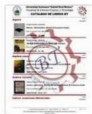
Catalogo Libros Ecuacione...