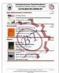
Catalogo Libros Cálculo (2...