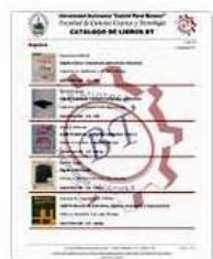
Catalogo Libros Álgebra (1...