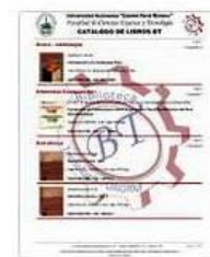
Catalogo Libros Física (322...